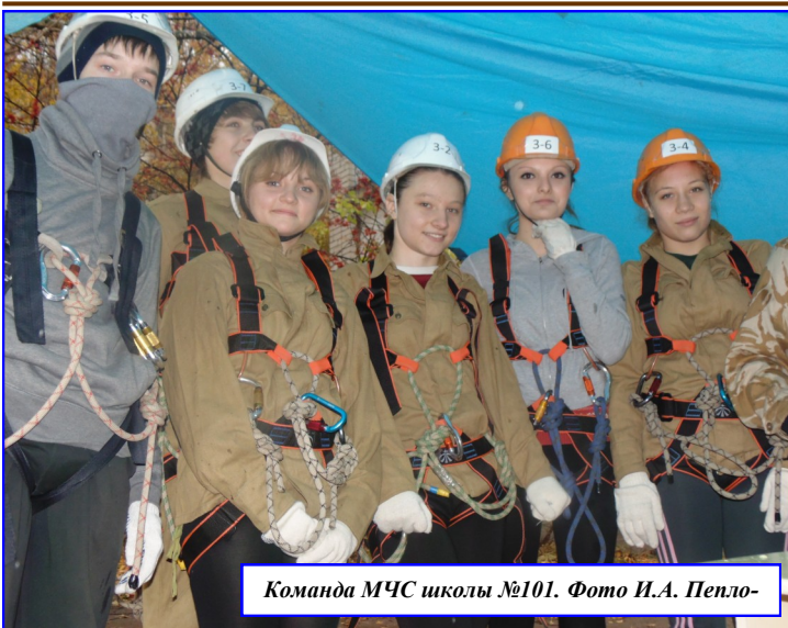
Команда МЧС школы №101.