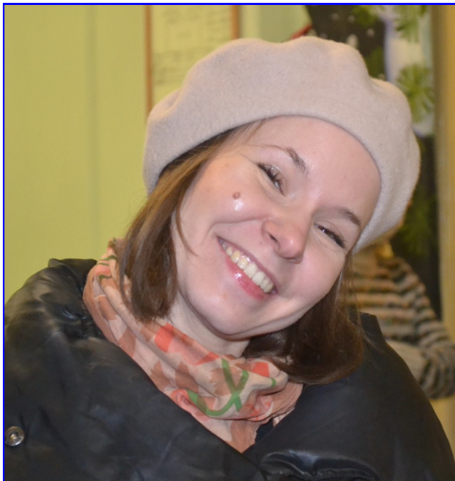
Выпускница школы №101