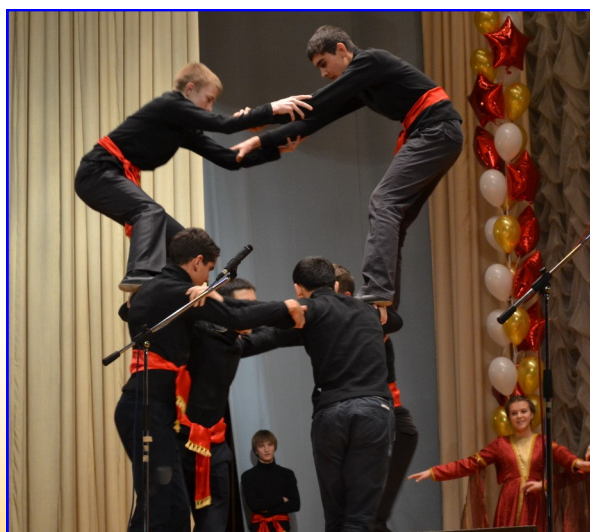
Незабываемый армянский. 10 А класс