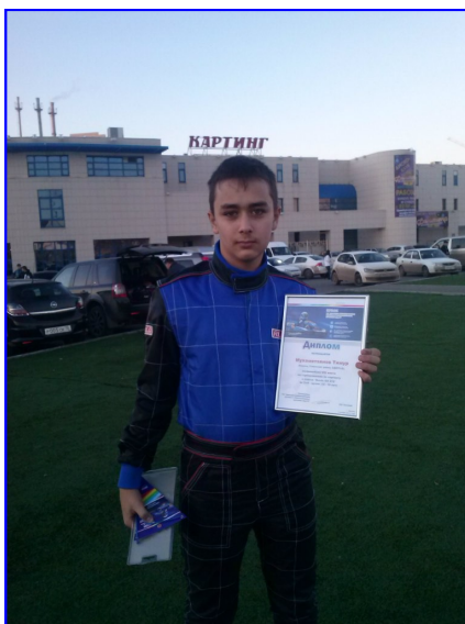
В здоровом теле — здоровый дух. Децим Юний Ювенал

обычным видом спорта, то заинте- ресовался историей возникновения картинга. «Кочуя» с сайта на сайт, собрал информацию, с которой хочу ознакомить и вас. Может быть, кто-то из ребят нашей школы решит, что гоняться на настоящих машинах со своими друзьями луч- ше, чем сидеть перед компьютером и играть в придуманные игры.